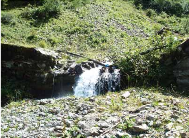
Größtenteils zerstörte Konsolidierungssperren im Oberlauf

Der Leonhardsbach ist ein "alter" Bekannter im Oberen Inntal. Vermurungen und Hochwasserschäden sind seit 1885 - die Arlbergbahn hatte gerade ihren Betrieb aufgenommen - bekannt.