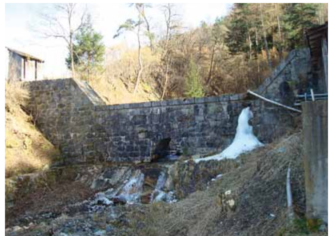
Die Geschieberückhaltebecken werden optimiert

Konsolidierungssperren sollen das Geschiebe an Ort und Stelle binden, die Errichtung ist jedoch speziell in dieser exponierten Lage sehr aufwändig und teuer. Von diesen Maßnahmen werden die Gemeindebürger, sofern sie nicht des Öfteren auf die Reichenbachalm wandern, wohl wenig mitbekommen. Die Maßnahmen sollten dann bis 2020 abgeschlossen sein.