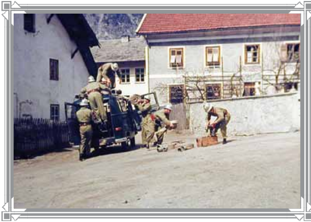
Gebäude am Kirchplatzl im Jahre 1963