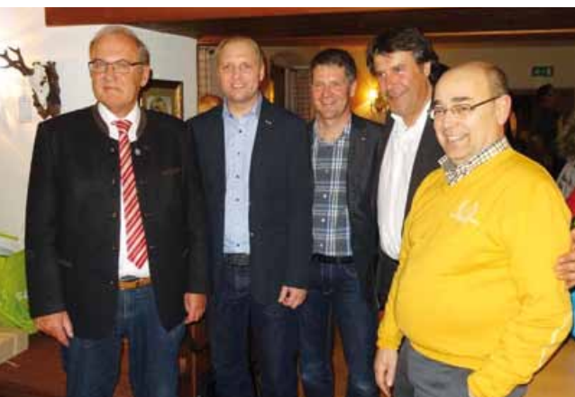
Die Gemeindevertreter aus Forchheim und Roppen

Wie schon in den Vorjahren, besuchte eine rund dreißigköpfige Delegation von Forchheimer Stadträten unsere Region, um einige Tage in der Bergwelt um Roppen verbringen zu können.