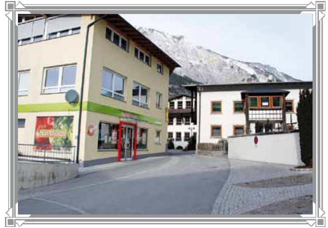
Die Ansicht heute (2015)