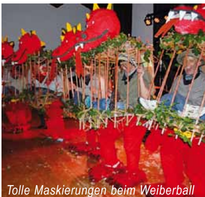
Tolle Maskierungen beim Weiberball

und willkommen ist. Und wer zu seiner Hl. Familie Hirte und Schafe dazustellen möchte, sollte sich den September im Auge behalten. Die Kurse werden rechtzeitig bekannt gegeben. Zum ganz besonderen Highlight des vergangenen Semesters zählt der schon traditionelle Weiberball. Auch der neuen Crew ist es aufgrund intensiver