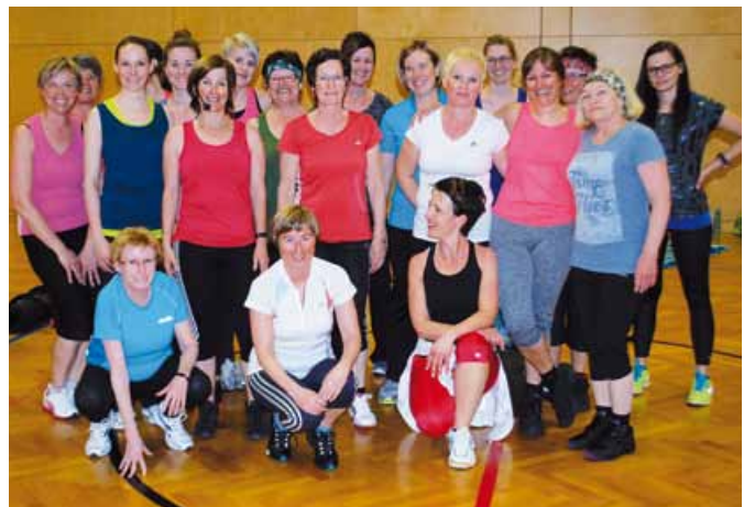
An die 50 Frauen treffen sich wöchentlich zum Frauenturnen im Turnsaal (siehe auch Bericht auf Seite 11)