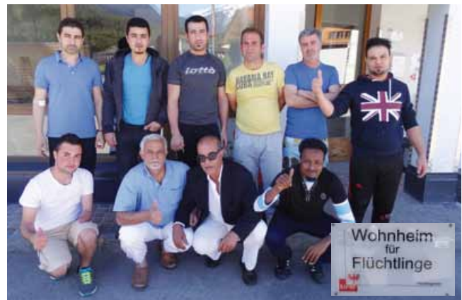
Einige der Flüchtlinge vor ihrer neuen Unterkunft Abwechslung geboten werden kann." (Bgm. Mayr)

Mittlerweile ist die Flüchtlingsgruppe auf 20 Personen angewachsen, auch zwei junge Familien aus ehemaligen Sowjetrepubliken leben in der Unterkunft, die von dem Sozialarbeiter Frank Donner betreut wird. Donner, der auch für die Heime in Sautens und Umhausen zuständig ist, freut die gute Aufnahme der Flüchtlinge in Roppen: "Wichtig ist es jetzt, den Menschen eine Tagesbetreuung - etwa durch Mithilfe bei Wegprojekten o.ä. - bieten zu können. Wir hoffen auf Unterstützung durch die Vereine, damit den Flüchtlingen etwas