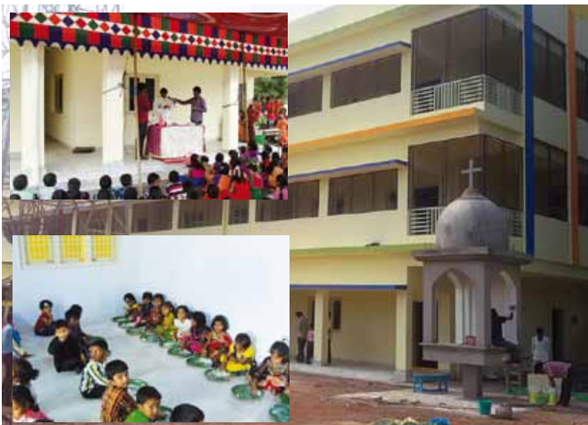
Die neue Schule in der Heimat Indien

Wir wissen doch, wie wichtig uns allen eine gute Ausbildung unserer Kinder ist. Es bedarf einer vernünftigen Aneignung von geistigen, kulturellen und lebenspraktischen Fähigkeiten, aber auch die Erweiterung der persönlichen und sozialen Kompetenzen ist wichtig, um in einer Gesellschaft erfolgreich zu sein. Diese Erfahrung machte Pfr. Peter Yeddapanalli,