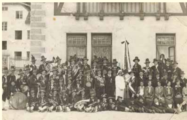
Einweihung der Burschenfahne 1929