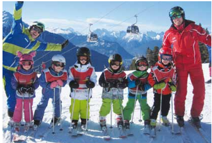
Auch heuer fand wieder ein Kindergartenschikurs im Schigebiet Hoch-Ötz statt.