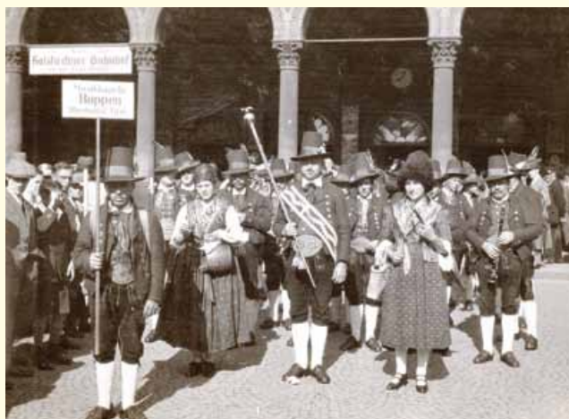
Die Musikkapelle Roppen 1927 beim Hauptbahnhof in München (Bhf. Holzkirchen)

Unsere Musikkapelle wurde im Jahre 1835 von Pfarrkurator Mayr gegründet. Mayr war nicht nur um die Seelsorge, sondern auch um das dörfliche Gemeinschaftsleben sehr besorgt, wie die Kirchenchronik berichtet. Als erste Kapellmeister fungierten ein gewisser "Steigenberger" und später Buchbinder Mathias, beide aus Imst. Zu dieser Zeit gab es aber keine geordnete Vereinsstruktur, die Musikkapelle war eher eine lose Verbindung musik- und sangesfreudiger Bürger. Auch das Instrumentarium ist kaum mit heutigen Verhältnissen vergleichbar. So bestand das Schlagwerk aus