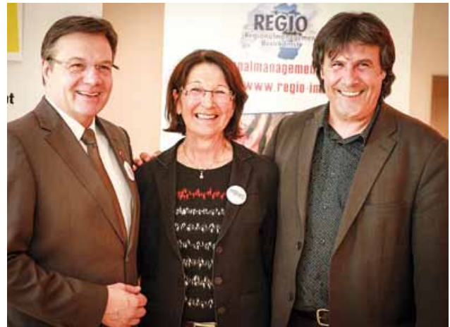
LH Günther Platter besuchte das Freiwilligenzentrum für den Bezirk Imst in Roppen