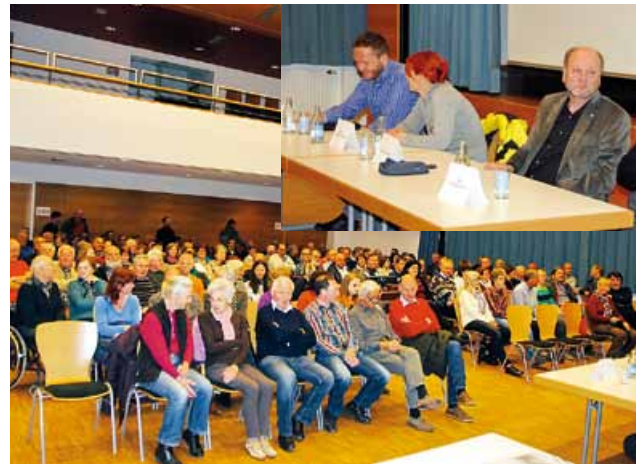
Zahlreiche Interessierte informierten sich über die neuen Erkenntnisse zum Tschirgant-Bergsturz

ge www.freiwillige-tirol.at über aktuelle Veranstaltungen und Projekte informieren. (gem)