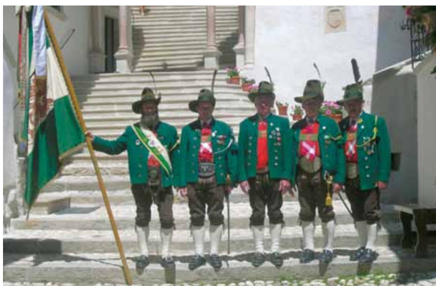
Die Abordnung der Roppner Schützen in San Romedius