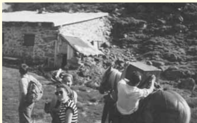
Die Tuxnerhütte 1958

Sollte jemand weitere Aufzeichnungen über die Almen besitzen, wären wir sehr dankbar, wenn diese Daten in die Dorfchronik einfließen könnten!