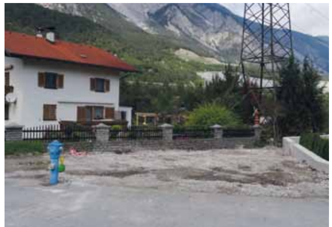
Baustelle für den Umkehrplatz Riedegg