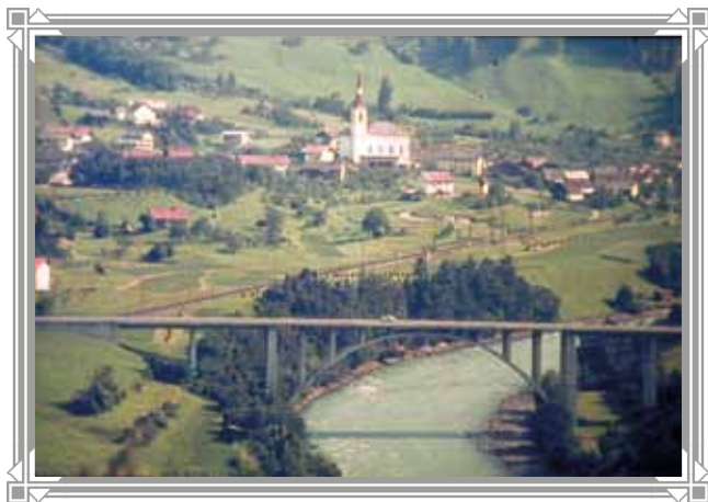
Ortsansicht Anfang der 1970er-Jahre