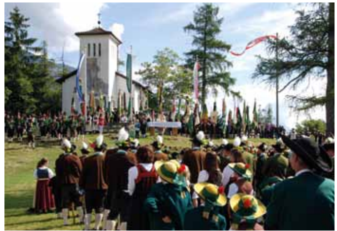
Eine wunderschöne Kulisse fanden die Schützen bei der Feldmesse bzw. beim Festakt am Burschl vor.