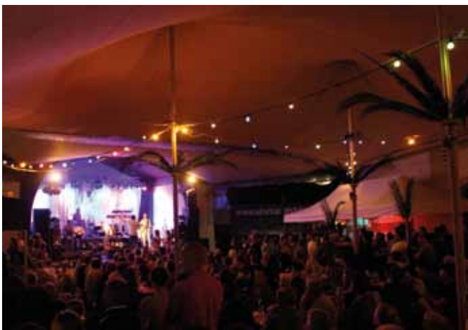
Beachparty-Feeling herrschte beim ausgezeichnet besuchten Schulschluss-Open-Air am Schulhausplatz

Der Leonhardsbach verursachte in der Vergangenheit mehrmals verheerende Vermurungen. 1891 berichtete das "Oberinntaler Wochenblatt" von der Katastrophe des Jahres. Der 2. Juli, der Unglückstag, wurde nun als verlobter Feiertag begangen. Nachdem das Fest Mariä Heimsuchung als gesetzlicher Feiertag gestrichen wurde, wird an den Werktagen des 2. Juli eine Abendmesse gefeiert und anschließend an den beiden Brücken des Leonhardsbaches der Bachsegnen erteilt. Für Pfr.