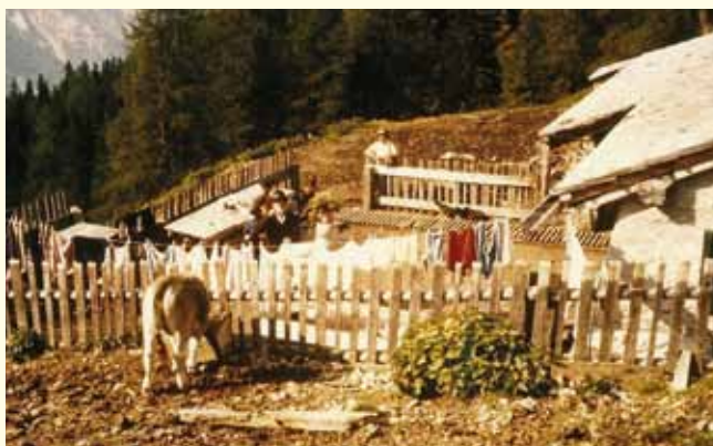
Die Reichenbachalm im Jahre 1964

So entstand eine Interessentschaftsalm, deren Nutzung ursprünglich nur den Viehhaltern aus diesen Weilern vorbehalten war. Auch diese Alm hatte mit der jetzigen "Tuxnerhütte" (frühere Bezeichnung "Leonhardshütte") eine zusätzliche Unterkunft für den Hochsommerbetrieb aufzuweisen.