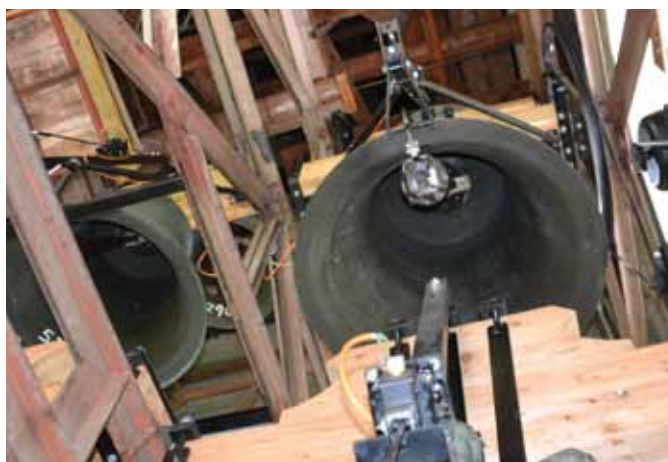
Blick in den neuen Glockenstuhl

Dass das Geläut der Kirchenglocken für viele aus dem dörflichen Leben nicht mehr wegzudenken ist, hat man sehr wohl verspürt, als sie während der Reparaturarbeiten für einige Zeit verstummten. Unsere Kirchenglocken - wie Pfar-