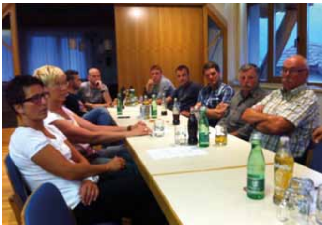
TUS-Versammlung im Gemeinde-Mehrzwecksaal

Vor allem das traditionelle Dorfskirennen war davon betroffen. Neben einer gewissen Amtsmüdigkeit dürfte auch diese Tatsache zum Rücktritt des Vorstandes beigetragen haben. Die Neuwahlen