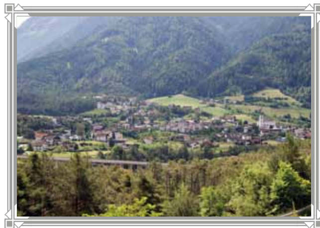
Aktuelle Ortsansicht im Sommer 2014