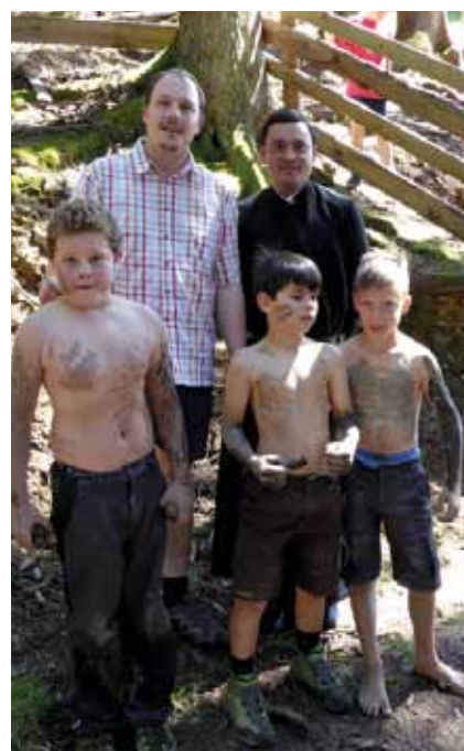
2 schöne Tage auf der Berwachthütte erlebten die Ministranten unseres Seelsorgeraumes.

Wer immer jedoch vor allem den Glockenschlag in der Früh als störend empfindet, möge bitte respektieren, dass doch sehr viele den neuen Tag mit einem Gedanken an unseren Herrn beginnen möchten. (rb)