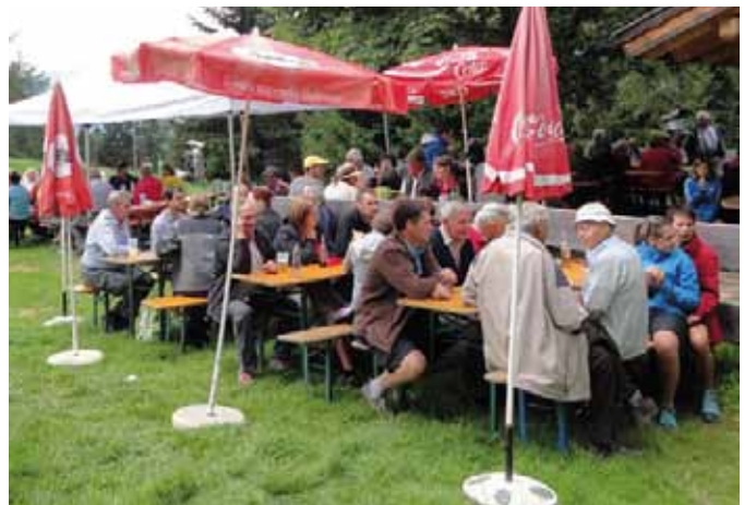
Das Bergwachtfest musste heuer witterungsbedingt vom 27.07. um 1 Woche verschoben werden.

Das letzte Mai-Wochenende 2014 stand in Roppen ganz im Zeichen des großen Bezirks- und Bataillonsschützenfestes der Schützenkompanie Roppen. Am Samstag trafen sich die Formationen – bestehend aus mehreren Schützenkompanien, Schützenabordnungen, verschiedenen Vereinsabordnungen, Ehrengästen sowie der MK Roppen – zur offiziellen Eröffnung der Feierlichkeiten inklusive Meldung, Frontabschreitung und Salve der Ehrenkompanie Karres am Löckpuitter Platzl. Anschließend marschierte der Festzug zum Kriegerdenkmal am Kirchplatz, wo neben Ansprachen eine feierliche Kranzniederlegung im besonderen Gedenken an den Ausbruch des I. Weltkrieges vor 100 Jahren erfolgte. Das große Schützenfest startete dann am Sonntag rechtzeitig in der Früh. Bereits um 8.15 Uhr trafen sich die Abordnungen aus nah und fern zur Aufstellung am Dorf-