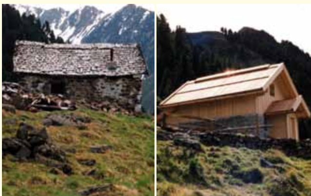
Die Mutehütte vor und nach der Sanierung

400 m weiter östlich im Bereich der letzten Kehre des heutigen Weges. 1980 wurde die neue Maisalm erbaut und 1981 eingeweiht. Als Hochalm diente die Weide im Bereich der Mute. Die Muthütte war die Unterkunft des Almpersonals im Hochsommer, das von der Maisalm mit Sack und Pack zur Mutalm übersiedelte. Die Weidefläche war zu dieser Zeit allerdings wesentlich größer, da ja von der Mais bis zum jetzigen Bereich der Mute ein vollständiger Kahlschlag vorhanden war. Die Unterkunft auf der Mute wurde ab den 1970er-Jahren nicht mehr benutzt und bald war die Hütte dem Verfall preisgegeben. Die Gemeinde überlegte lange, ob eine Abtragung oder eine Renovierung sinnvoll wäre. Mit der Aussicht auf eine Nachnutzung durch den Alpenverein wurde in den 1990er-Jahren die Hütte von Grund auf saniert und präsentiert sich heute als alpines Schmuck-