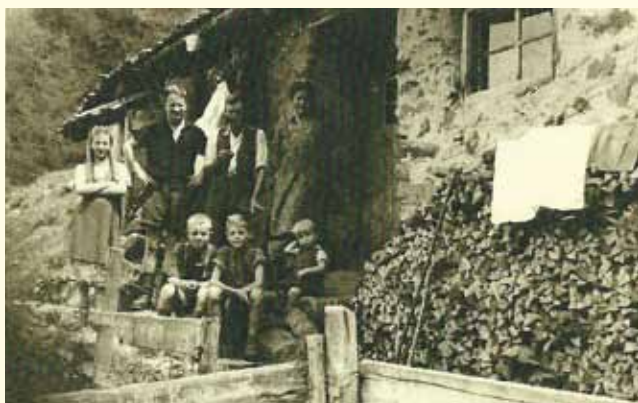
Die alte Maisalm

Über die Roppner Almen ist geschichtlich sehr wenig aufgezeichnet. Trotzdem bietet die Entstehungsgeschichte unserer Almen auch für die Dorfchronik einige interessante Erklärungen. Bis vor drei Jahrzehnten gab es in Roppen zwei unabhängige bewirtschaftete Almen: Die Maisalm als Gemeindealmen und die Reichenbachalm als Interessentschaftsalm. Der Rückgang der Viehhaltung im Dorf und die anfallenden Kosten für den Almbetrieb führten zu einer Zusammenlegung beider Almen und damit zur heutigen Situation. Die Maisalm war früher zweigeteilt: Die ursprüngliche Hütte stand etwa