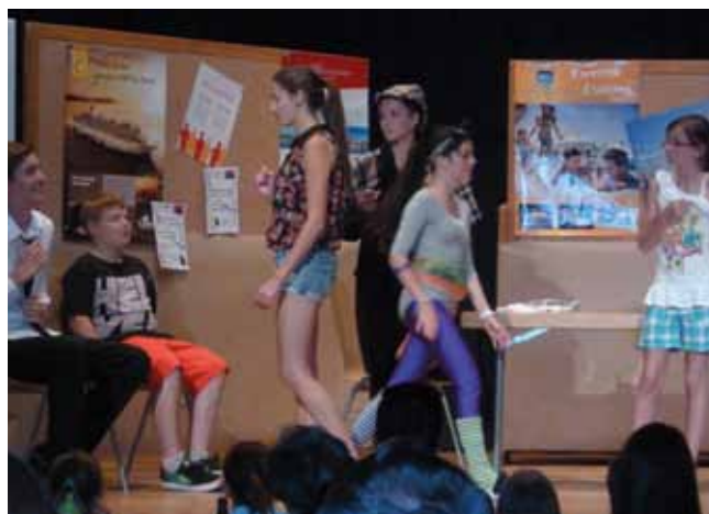
Tolle Darbietung der Kinder u. Jugendlichen

Am 14. und 15. Juni war es wieder so weit. Die 14 Kinder und Jugendlichen des Kinder- und Jugendtheaters haben an 2 Abenden das zahlreich erschienene Roppner und auch von weiter angereiste Publikum mit ihren frischen und fröhlichen Darbietungen begeistert.