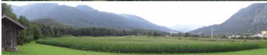
Geplanter See im Bereich der Ötzbrucker Felder südlich der Bahntrasse