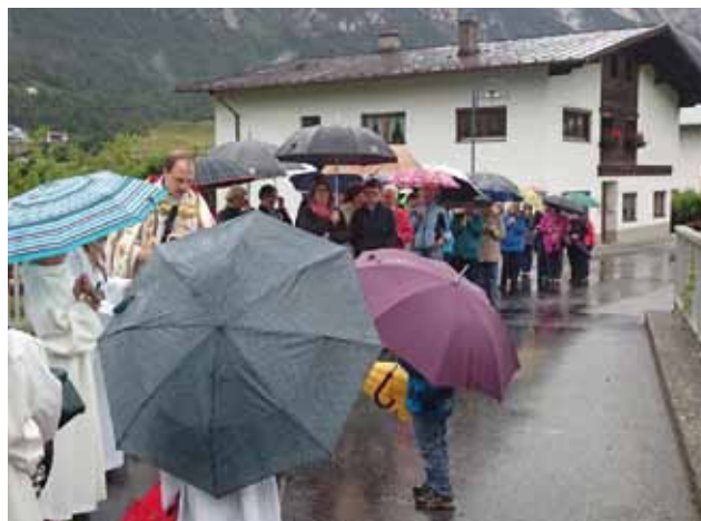
Zahlreiche Gläubige nahmen heuer trotz dem Regenwetter am Bachsegnen zu Mariä Heimsuchung teil.