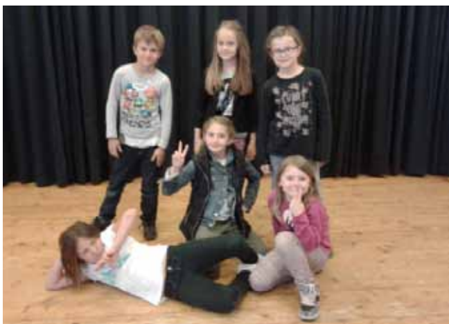
Die jungen Schauspieler beim Fotoshooting