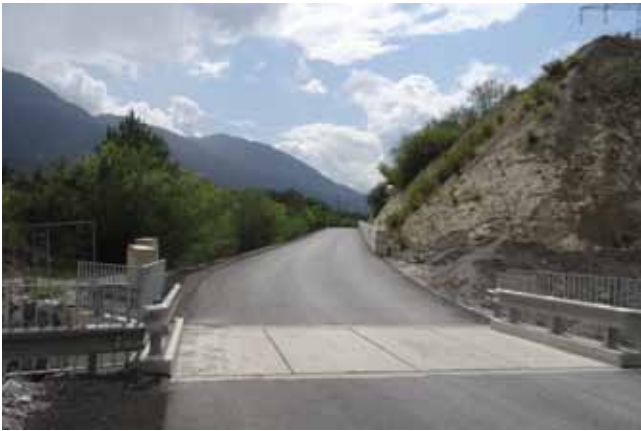
Die neue Brücke an der östlichen Straßeneinbindung

Mit dem Bau der Verbindungsstraße zwischen den Firmen MS-Design und Fröschl/Nagele wurde einer langen Forderung der BH Imst nachgekommen.