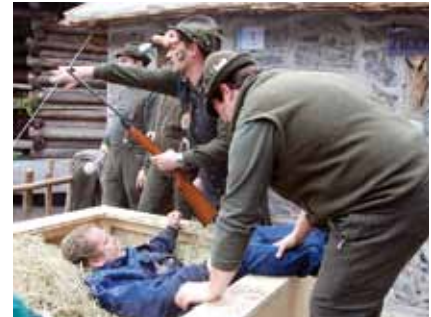
Das Team der Tuxnerhütte lud bei der Auskehr in ihren Jakusie.

schlechten Wetters nicht nehmen, den Erzählungen der Tschirgethex zu lauschen, welche wie immer viele Gegebenheiten und Missgeschicke aus unserem Dorf zu berichten wusste.