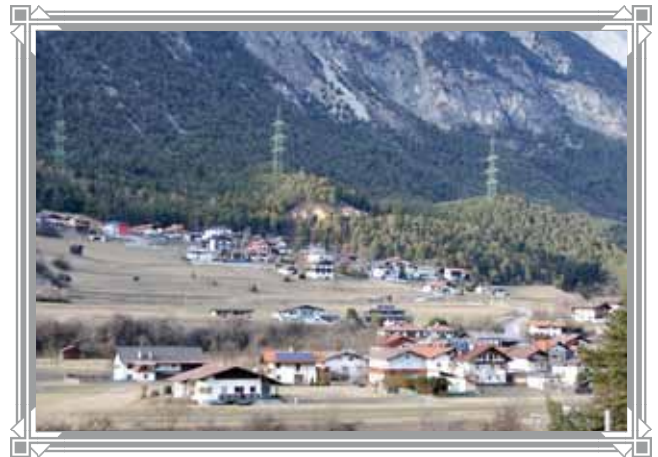
Ansicht der „Trankhütte“ in den 1960er-Jahren