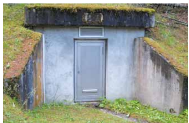
Der sanierungsbedürftige HB Hohenegg

Im Frühjahr konnten die Arbeiten am Hochbehälter Oberängern abgeschlossen werden. Der Hochbehälter ist jetzt technisch und optisch wieder in einem sehr guten Zustand. Auch die