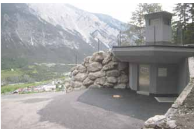
Der 2013/14 renovierte Hochbehälter Oberängern