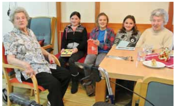
Die Schülerinnen der NMS im Altersheim Haiming