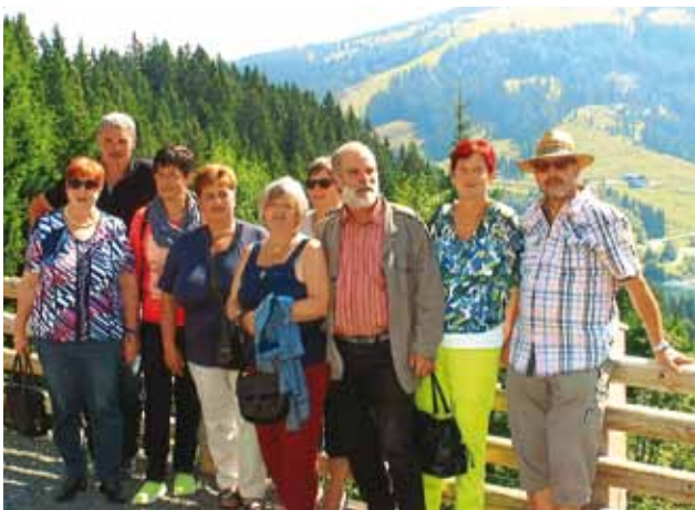
Der Jahrgangsausflug 1953 führte die Roppner Neo-60er nach St. Veit im Defereggental