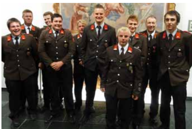
Die geehrten bzw. beförderten Feuerwehrkameraden

Vom Löschmeister zum Oberlöschmeister wurden befördert: