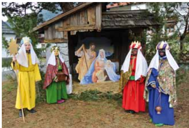
Sternsingergruppe am Löckpuitter Platzl

Prozent. Und österreichweit gab es ein Ergebnis von 16,1 Millionen Euro. Immer wieder sind Menschen in den Projekten, denen die Sternsingerspenden zugute kommen, überwältigt von unserer Hilfe, die hauptsächlich von Kindern, Jugendlichen und engagierten Erwachsenen in Pfarren getragen werden. (rb)