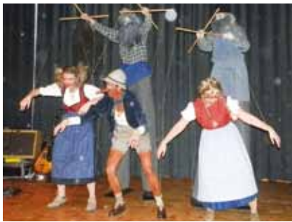
Pinocchio-Gruppe beim Weiberball