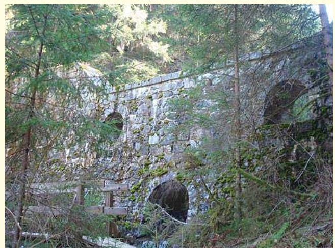
Untere Murensperre beim Leonhardsbach

"Der Leonhardsbach ist einer der bösesten Wildbäche des Oberinntales, da die Murbrüche ganz unvermittelt nach Gussregen oder Hagelschauer zu Tal kommen. Im Oberlaufe ist der Bach bereits ziemlich weitgehend verbaut, doch genügen die eingezogenen Sperren nicht, um Anbrüche vollständig hintanzuhalten. Vor allem muss getrachtet werden, ein seitliches Ausbrechen der Muren beim Austritte aus der Klamm in die Felder zu verhindern."