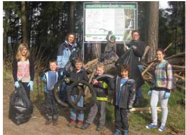
Eine der fleißigen Gruppen, welche den Müll entlang der Wege einsammelten

Gespannt erwartet die Gemeindeführung die noch ausstehenden Ergebnisse der Bedarfserhebung seitens der Energie Tirol, auf deren Basis für die Zukunft eine bessere Nutzung von neuen Energiequellen sowie die wärmetechnische Sanie-