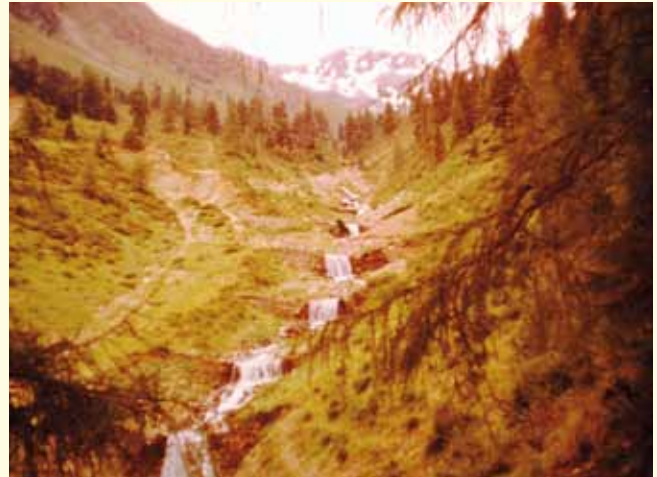
Obere Verbauung der „Ritsche“

Regulierung des Unterlaufes und Errichtung von Sperren im Oberlauf führte. Am 7. November 1932 kam es zur Verhandlung, in der die wasserbehördliche Genehmigung zur Errichtung von zwei Sperrmauern erteilt wurde. Diese wurden 1937/38 erbaut und dienen heute noch als wichtige Schutzvorrichtung. Interessant die protokollierten Aussagen des Amtstechnikers bei der Verhandlung: