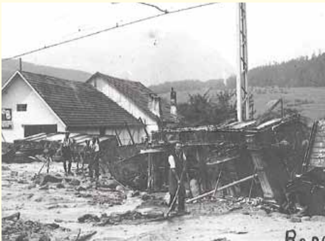
Murenunglück am 29. August 1928

In einer der letzten Gemeinderatssitzungen war der Leonhardsbach bzw. dessen Verbauung wieder einmal ein fixer Tagesordnungspunkt. Dieser Bach, der meist sehr harmlos durch Roppen fließt und in den Inn mündet bewegt die Roppner seit langer Zeit und eigentlich durchgehend.