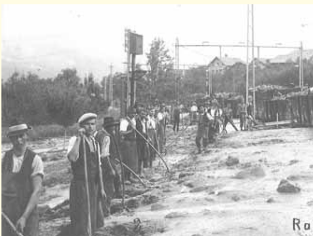
Mehrere beladene Kohlewagens entgleisten durch die Mure

Das Gefahrenpotenzial dieses Gewässers ist weitaus größer, als es der Anblick bei normalen Witterungen vermuten lässt. Diese Erkenntnis ist allerdings nicht neu, genauso wie die vielfachen Versuche der Gemeinde mit Verbauungen die Gefahr zumindest kalkulierbarer zu machen. Aus der Dorfgeschichte kennen wir die großen Murbrüche aus den Jahren 1891, 1893, 1928 und 1929.