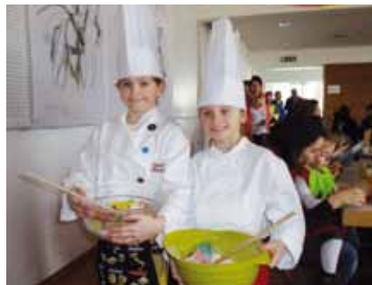
Die Kinder fühlten sich beim Kinderfaschingsball sehr wohl.

schaft im Kultursaal veranstaltet wurde und wie bereits 2013 den Saal füllte. Zahlreiche Kinder kamen verkleidet mit und auch ohne Eltern an diesem Tag um gemeinsam zu tanzen, singen und einfach Spaß zu haben. Für eine kleine Stärkung zwischendurch wurde natürlich auch ausreichend gesorgt.