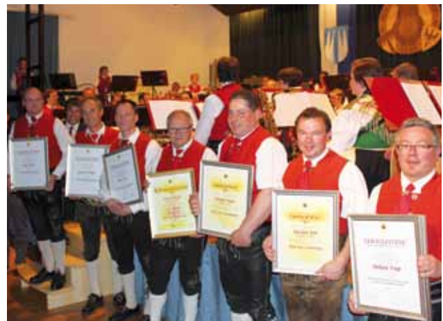
Die anlässlich des Frühjahrskonzertes 2014 geehrten Musikanten der MK Roppen - siehe Bericht auf S. 12