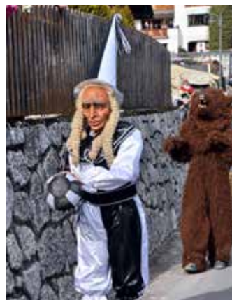
Turesackner Fasnacht 2020.