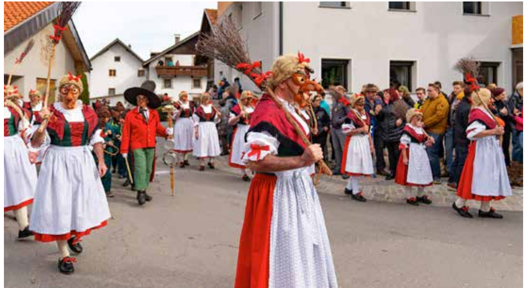
Die Hexen 2020.

das sogenannte „Gschnapp“, besteht aus zwei Teilen: „einer Larve mit Nase und Augen sowie einem separaten Kinn“. Am Kopf trägt sie eine Perücke aus Hanf mit zwei Zöpfen.