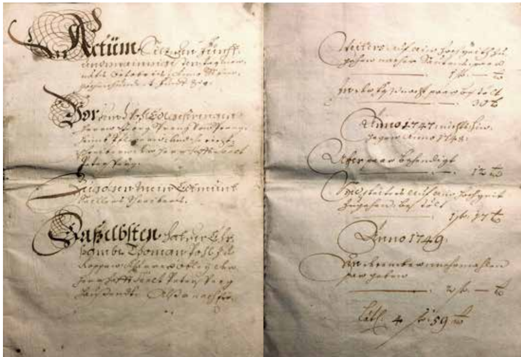
Urkundliche Vermögensabhandlung mit der schriftlichen Erwähnung anno 1746.