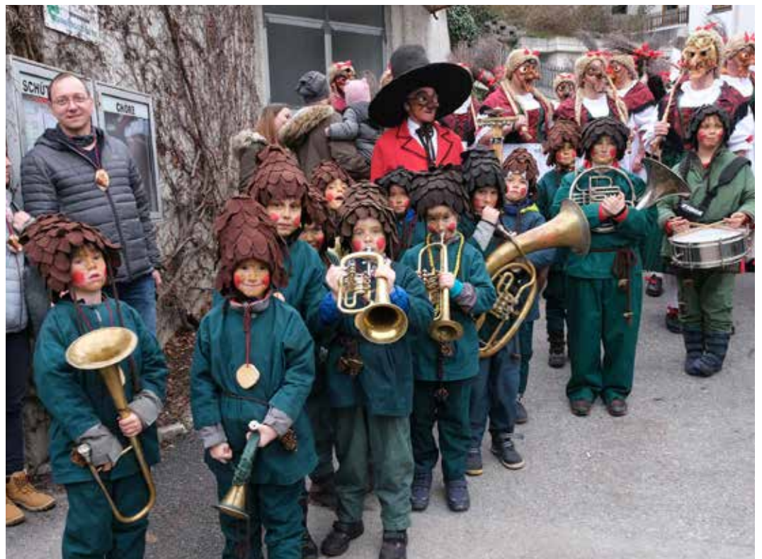
Hexenmusig Fasnet 2020.