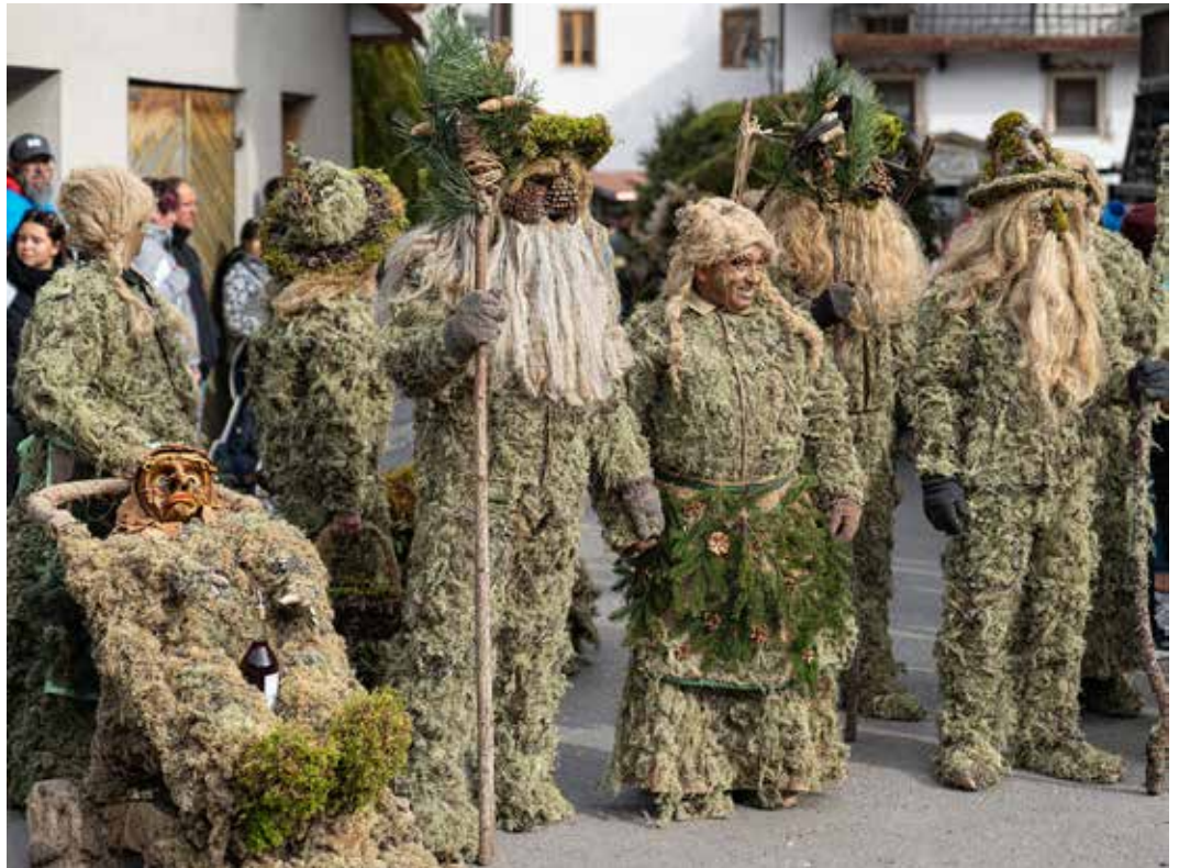
Waldmandle bei der Fasnacht 2020.