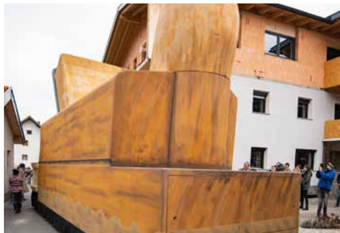
Wagenbaugruppe „Burschlbuabe“ 2020.