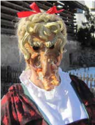
Hauptfigur der Roppner Fasnacht: Die „Tschirgethex“.

Die Tschirgethex führt das Oberkommando über die Roppner Hexen und ist gleichzeitig auch die Leitfigur der Roppner Fasnacht. Hexen waren in den Köpfen der Dorfbewohner immer schon fest verwurzelt. Im Bereich des Tschirgants oberhalb von Roppen gibt es die sogenannten Kitzlöcher,