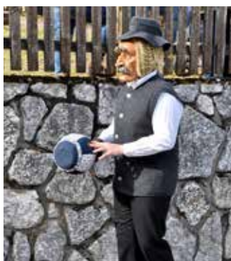
Bauresackner Fasnacht 2020.

Die Säcknerin (Wiflig) trägt eine bäuerliche Festtagstracht aus dem Oberland, bei welchem der Trachtenrock aus Unmengen von Stofffalten genäht ist. Als Kopfbedeckung dient eine Fellhaube oder eine Fatzelkappe. Alle Ordnungsmasken haben einen runden Stoffballen (den Sack) in der Hand, mit welchem sie Platz für den „Kroas“ schaffen.