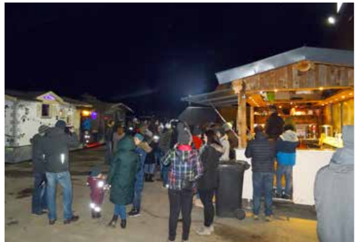
Feier der Wagenbaugruppen 2020.