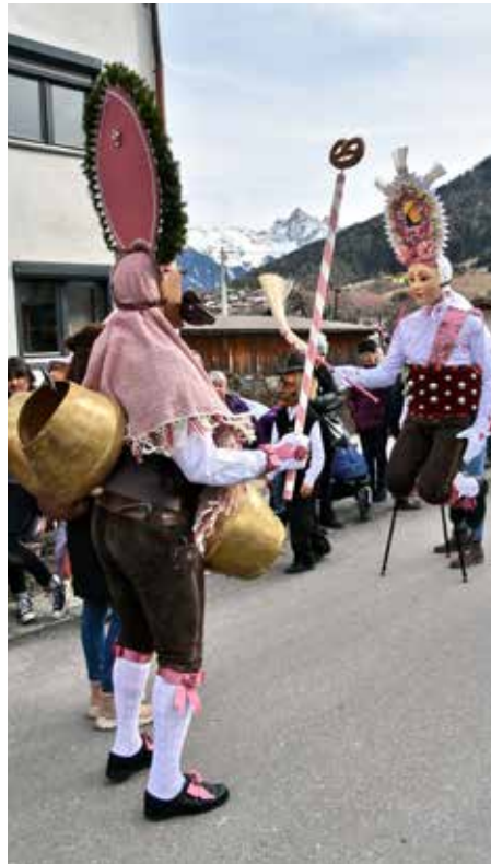
Ein Paar beim „Gangle“, Fasnacht 2020.

Der Schaller symbolisiert den zu Ende gehenden Winter. Seine Larve hat sehr ausgeprägte Gesichtszüge und einen breiten, kraftvoll ausladenden Oberlippenbart. Den Namen hat er von seinen Schellen, dem „G’schall“, welches er über seinen Schultern trägt. Dieses bringt der Schaller beim „Gangle“ durch schwingende Bewegungen zum Erklingen. Bekleidet ist der Schaller mit einer schwarzen Kniebündlerhose, einem weißen Trachtenhemd, einer schwarzen Krawatte und über den Schultern trägt er eine mit Mustern bestickte Tischdecke.