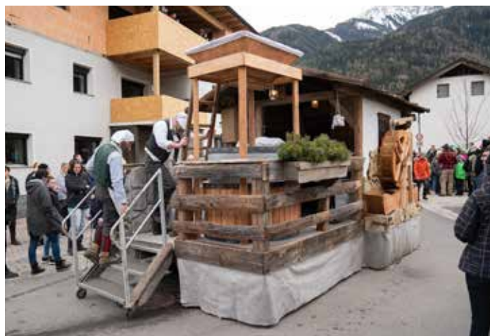
Wagenbaugruppe „Schuachteler“ 2020.