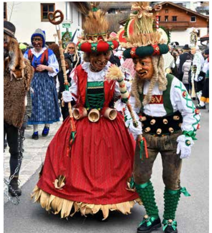
Lagge-Paar bei der Fasnacht 2020.