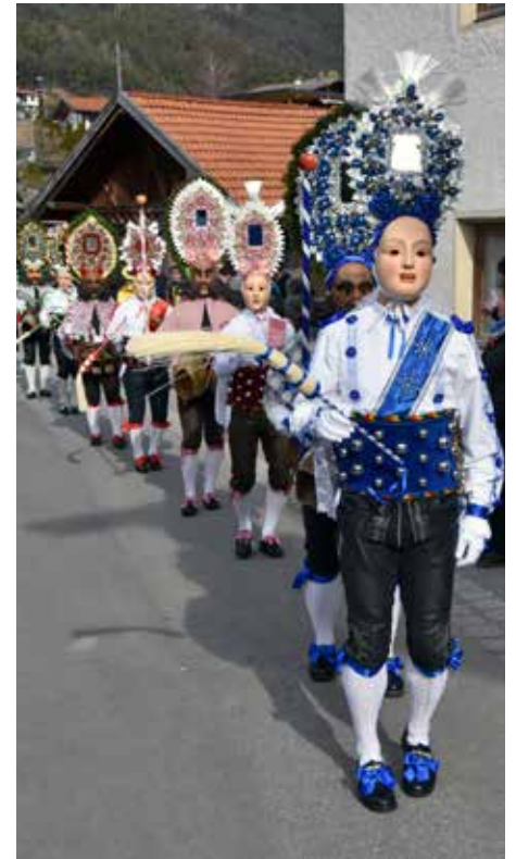
Aufwändig geschmückte Roller und Schaller.