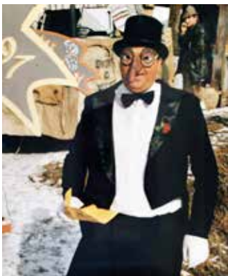
Deklamator Fasnacht 1991.

Bei der Labera werden besonders humorvolle und verhängnisvolle Vorkommnisse aus unserem Dorf in Form von Gedichten und Liedern auf satirische Weise wiedergegeben. Für das „Opfer“ ist es eine besondere Ehre, sich im Anschluss an den Vortrag in das Laberabuch einzutragen und selbstverständlich auch einen kleinen Obolus zu entrichten.