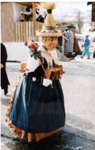
Lagge-Paar bei der Fasnacht 1991.

Mann und der Laggeschaller eine alte Frau. Für diese Kostüme werden meist Feldfrüchte wie Ähren, Maisflitschen oder Sonnenblumen verwendet. Diese Maske begeistert oft schon alleine durch ihren gemächlichen Auftritt.