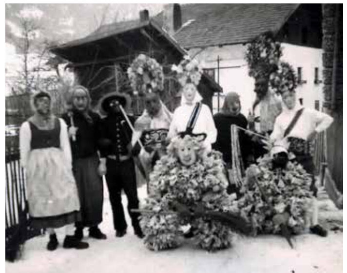
In den 50er Jahren.