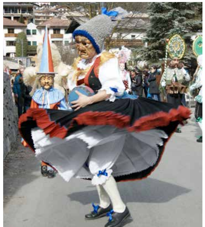
Wiflig Fasnacht 2020.