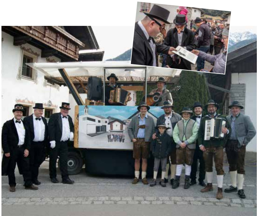
Die Laberagruppe 2020.