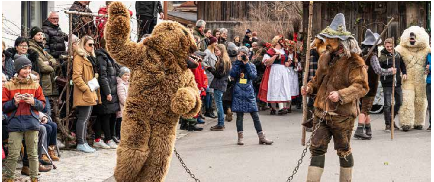
Bär und Bärenreiber 2020.

heren Zeiten dar. Er ist mit einer Felljacke und einer Kniebundhose bekleidet, seine Larve ist eher dunkel gefasst und hat einen grimmigen Gesichtsausdruck.