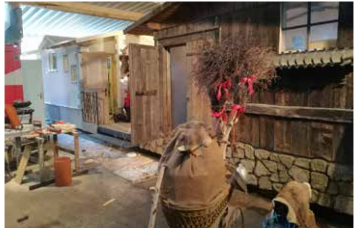
Wagenbau der Hexen 2020.

Das Auskehren, welches in Roppen alle zwei Jahre stattfindet, beendet dann das Fasnachts-treiben und schon manch einer