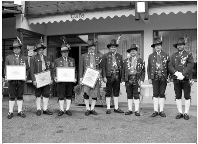
Geehrte Schützen am Herz-Jesu Sonntag vor dem Gasthof Rudigier.