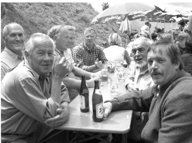
Einige Feste konnten heuer auf dem Berg gefeiert werden. Hier ein Bild vom Fest auf der Maisalm.

Die Musikkapelle veranstaltete bereits am Vortag des Kirchtagsfestes einen Dämmerchoppen mit den "Oldies der Volksmusik", großteils besetzt mit ehe-