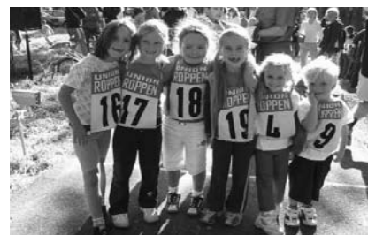
Junge Läuferinnen

Seit dieser Zeit wird alljährlich zu Pfingsten ein Fußballturnier durchgeführt. Selbst auswärtige und ausländische Vereine werden in Roppen begrüßt. 1980 organisierten die Sektionen der TUS auf Anregung von Egmont Maier einen