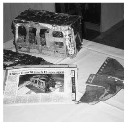
Fundstücke vom Absturz

Mit einem fulminanten Auftakt (sieben Siege in Serie!) startete unsere Kampfmannschaft in die neue Fußballmeisterschaft. Die Mannen rund um Neo - Coach "Richi" Egger konnten vorübergehend sogar bis an die Tabellenspitze stürmen. Ein wenig getrübt wird die Herbstsaison jedoch von vier bitteren Niederlagen in den letzten Spielen. Es steht noch ein Spiel gegen St. Leonhard aus, bevor man in die wohlverdiente Winterpause geht. Für die Spieler gilt es nun, die letzten Kraftreserven zu mobilisieren und dieses eine Match zu gewinnen, um den Anschluss an die Tabellenspitze nicht zu verlieren. Der Aufstieg wäre damit noch immer in Reichweite! Besonders erfreulich ist in dieser Spielsaison, dass einige talentierte und eifrige Nachwuchskicker den Weg in den Kader der Kampfmannschaft gefunden haben. Wir möchten uns an dieser Stelle recht herzlich bei den Nachwuchstrainern für ihre vorbildliche Arbeit mit den jungen Fußballern bedanken! j b