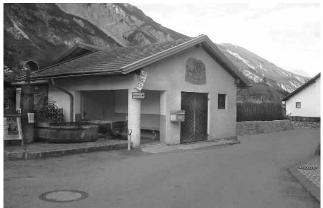
Die entschärfte Engstelle beim Brunnen.