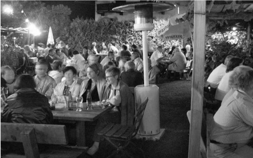
Viele Feinschmecker besuchten die Weinwoche