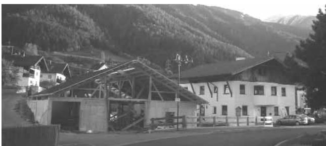
Der Rohbau des neuen Laufstalles