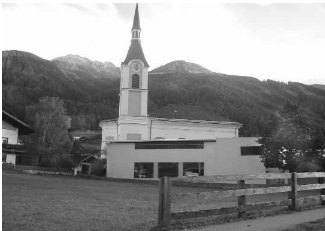
Grundstück der Fam. Ennemoser