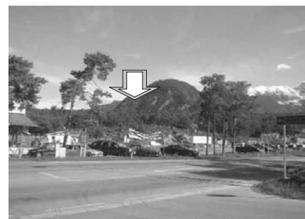
Das Gelände für das neue Gewerbegebiet (siehe Pfeil)