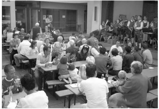
Nach einem verregneten Vorabend konnte der Kirchtag bei schönem Wetter am Schulhausplatz gefeiert werden.