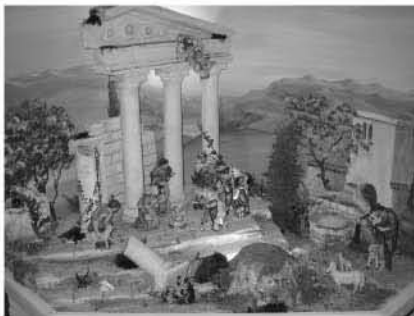
Krippe von Köll Werner, Krippenbauverein Wennis

Di 21. Dezember 18.00h - Schulweihnacht im Kultursaal