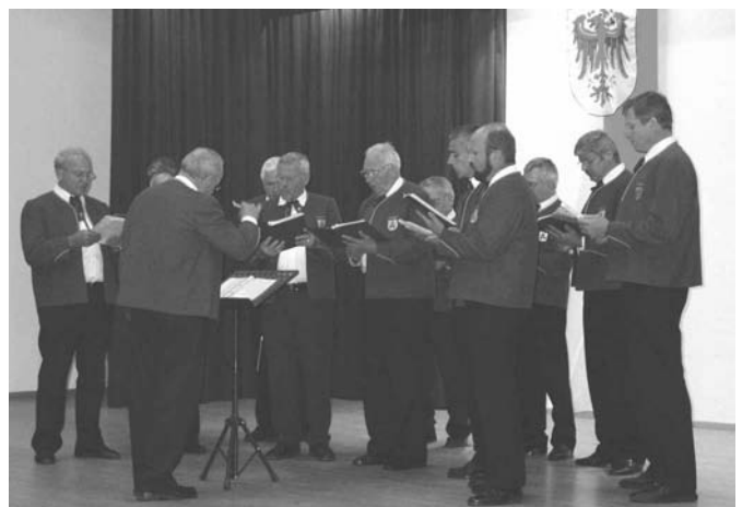
Der Männerchor Karrösten war einer der Gastchöre anlässlich des Sängerfestes.