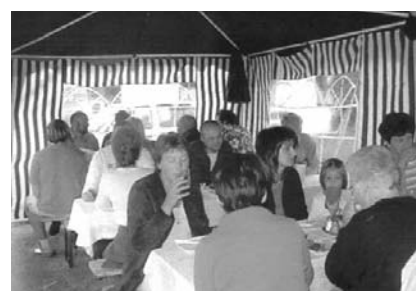
Viele Gäste besuchten die Riedlefestle (im Bild Oberängern).

platzerrichtung am alten Sportplatz verwirklichen zu können, entschlossen sich einige Wolfauer spontan ein Festl abzuhalten. Viele folgten der Einladung und es wurde ausgedehnt gefeiert. Alle freuten sich über den Reinerlös von 2000 Euro, die für die Anschaffung weiterer Spielgeräte verwendet werden. Ein herzlicher Dank ergeht an die Gemeinde, die diesen Platz zur Verfügung gestellt und das Material für die diversen Spielgeräte finanziert hat. Enga-