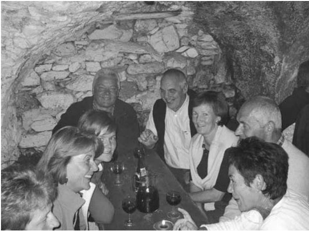
Besonders wohl fühlten sich die Besucher des Brunnenfestes der Feuerwehr im urigen Weinkeller.