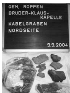
Funde aus der Bronzezeit

7. Oktober 1962: Viele Gläubige aus dem Dorf und aus der Umgebung machen sich auf den Weg zur Einweihung der neuen Kapelle auf dem Burschl. Ein Vortrag über den heiligen Einsiedler Nikolaus von der Flüe (1417 -1487) aus Sachseln in der Schweiz gab den Anstoß zum Bau dieses Kirchleins auf einem Hügel, der bereits vor ca. dreitausend Jahren besiedelt war.