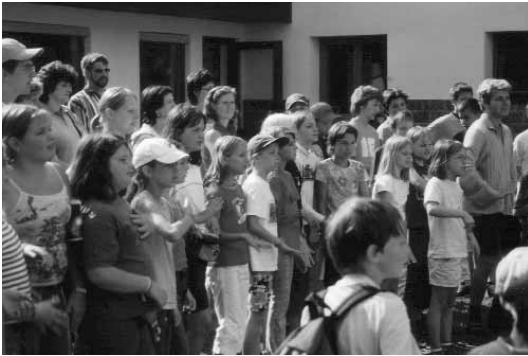
Die Minis beim gemeinsamen Spiel

In der letzten Juliwoche verbrachten 6 Kinder aus unserer Pfarre ihre Ferien in Radfeld. Sie folgten einer Einladung, die von der Kath. Jungschar der Diözese Innsbruck an Ministranten und Ministrantinnen aller Pfarreien erging. Insgesamt nahmen 94 Kinder an dieser Ferienaktion teil. 16 Betreuer und Betreuerinnen sorgten sich um das Wohl der "Minis", von denen sehr viele das erste Mal ohne Familie fort waren. Das Angebot war so groß, dass den Kindern nicht viel Zeit blieb, an Daheim zu denken. Es wurden Gruppenstunden angeboten, interessante