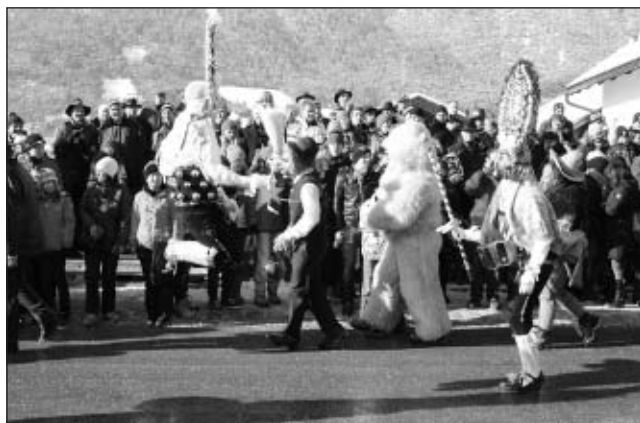
Roller- und Schallerpaar beim „Gangle“ vor der Ehrentribüne

Auch die aufwendig gebauten Wagen mit den dazugehörigen Gruppen waren Anziehungspunkt für Jung und Alt und sorgten für gute Unterhaltung. Natürlich durfte auch heuer die traditionelle Labera, in der das ein oder andere Missgeschick der Roppener festgehalten wurde, nicht fehlen. Sie sorgte bei den Besuchern für großes Gelächter. Der Umzug fand schließlich pünktlich um 18:00 Uhr beim Gasthof Karlsruhe mit dem "Schlusskroas" sein Ende. Erschöpft nach dem langen Tag, aber sichtlich stolz über die wunderschöne Fasnacht, wurde dann noch bis in die frühen Morgenstunden ausgiebig gefeiert und noch so manches "Gangle" gemacht. Die Fasnachtler unter Obmann Werner Pfausler bedanken sich auf diesem Weg noch einmal recht herzlich bei der großartigen Unterstützung der Roppener Vereine, der Gemeinde, den Anrainern und natürlich auch bei den vielen Roppener Firmen, die als Sponsoren aufgetreten sind. In diesem Sinne freuen wir uns, wenn es in 4 Jahren wieder heißt: "D'Roupner gia wieder in d'Fásnacht". (Fasnachtsverein)