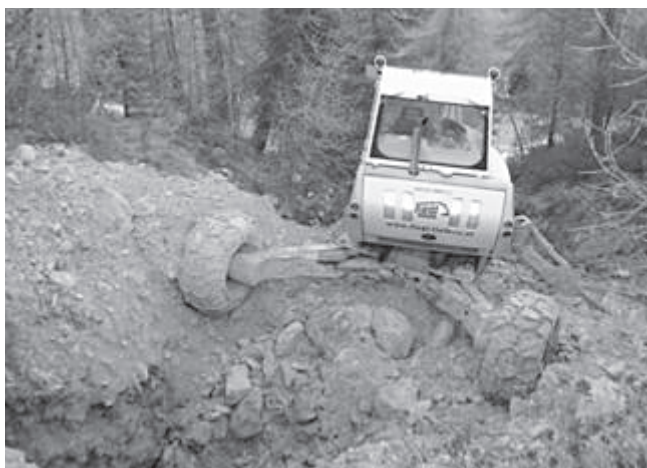
Für die Grabungen kam ein Schreitbagger zum Einsatz...