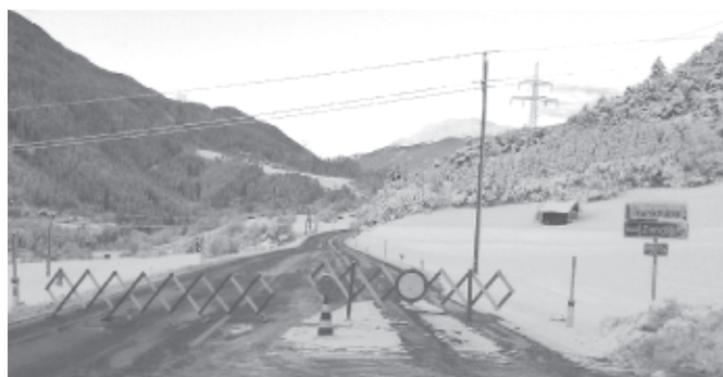
Ein seltenes Ereignis gab es im Winter 2011/12: Sperre der Bundesstraße in Roppen wegen Neuschnee

Der vergangene, schneereiche Winter sorgte für zufriedene Gesichter bei den Touristikern, WintersportlerInnen und Kindern - aber auch für sehr viel Arbeit: Vor allem unsere Bauhofmitarbeiter mussten viele Überstunden machen, um der Schneemengen Herr zu werden. Ab