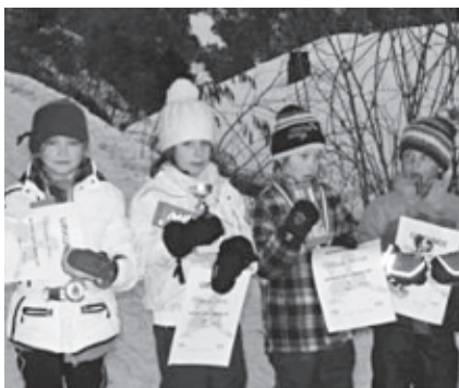
Die jüngsten Teilnehmer