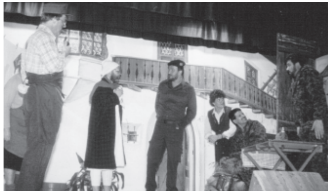
„Gemeinderat auf Urlaubsreise“, 1988