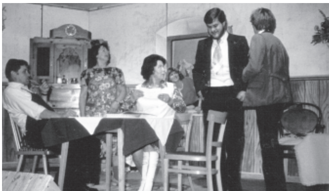
„Die pfiffige Urschl“, 1980