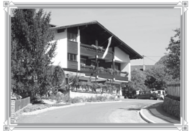
Das Cafe-Restaurant Rudigier im Jahre 2012.