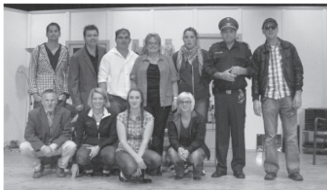
„Wohin mit der Leich?“, 2011