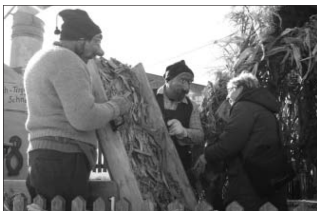
Rauh her gings auf dem „Schuachtelerwöge“