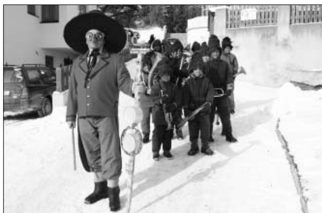
Nicht fehlen durfte die „Hexenmusik“