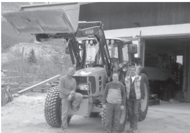
Der Roppener Gemeindebauhof verfügt nun auch über einen neuen Gemeinetraktor