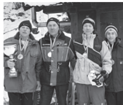
Die Gruppensieger FW II

Durch die gute Schneelage im heurigen Winter konnten wir wieder zwei tolle Rodelrennen durchführen. Am Sonntag, den 29.01. 2012 fand das legendäre Dorfredrennen statt, bei dem 44 mutige Rodler die gut präparierte Bahn hinunter fuhren. Auf Grund der guten Bedingungen konnte das Dorfredrennen in zwei Wertungsläufen durchgeführt werden.