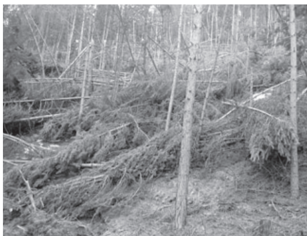
Enorme Waldschäden entstanden durch die hohen Schneelasten im Winter 2011/12