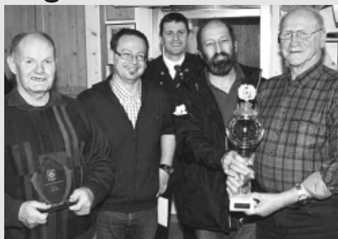
Das erfolgreiche Herren-Team der Schützenkompanie