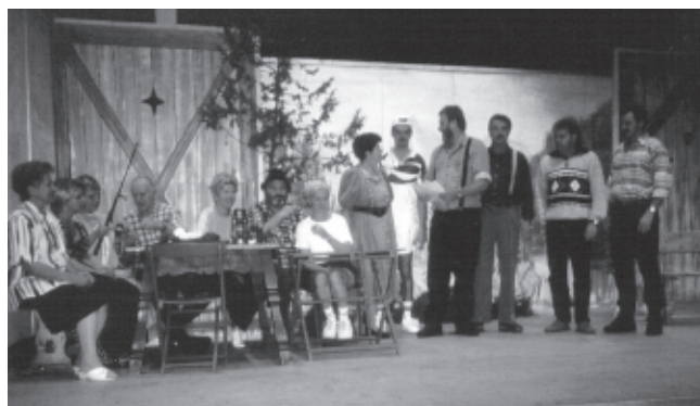
„Urlaub am Bauernhof“