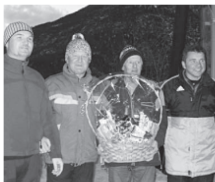
Der älteste Teilnehmer