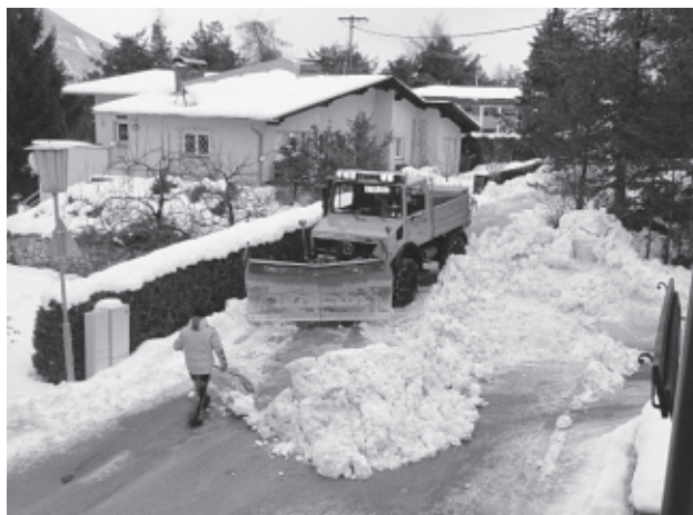
Danke an die Gemeindearbeiter für die perfekte Schneeräumung im strengen Winter 2011/12!