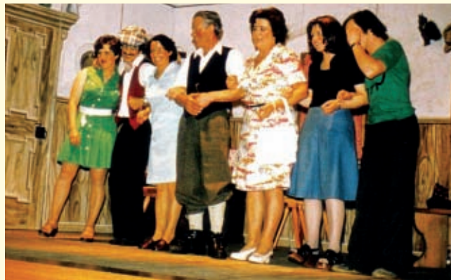
Erste Aufführung 1975: "Der Saisongoekel"

sein Nachfolger und echte Komödiant: der Tischlers (Raggl) Le', der 1984 ganz plötzlich starb.