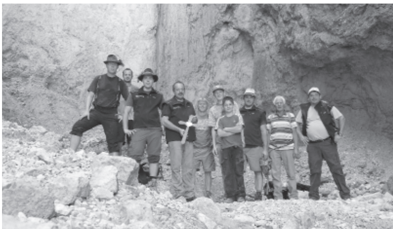
Die Bergfeurergruppe „Mittagloch“ mit dem neuen Kreuz