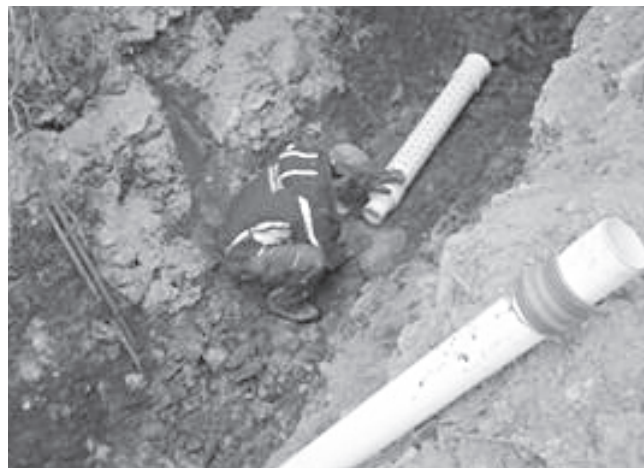
... aber auch Handarbeit war gefordert