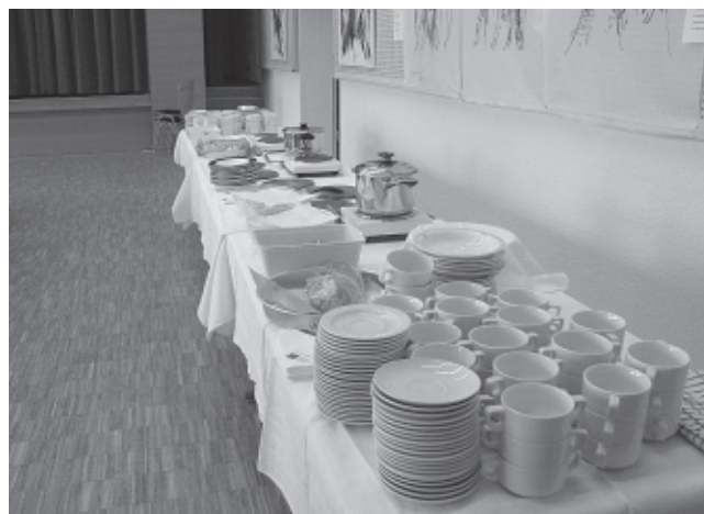
Die "Suppentheke" ermöglichte ein flottes Austeilen der Suppen beim Ansturm um die Mittagszeit.

Auch Manfred vielen Dank, der sich immer um die Tische und Stühle und um das Putzen kümmert. (M.Th.Heiß)