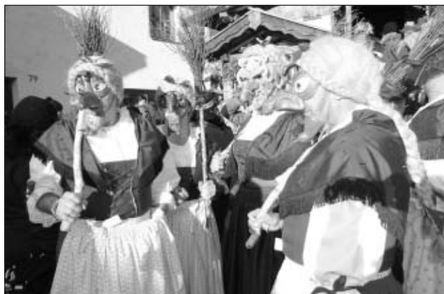
Eine starke Hexentruppe war ebenfalls dabei